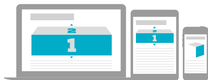
Paraatikuutiopaketti CPM 25€ 980 x 400px + 300 x 600 px