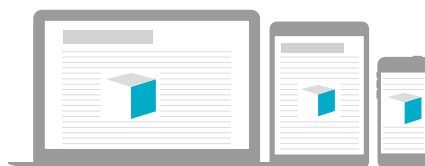
Boksikuutiopaketti CPM 12€ 300 x 250 px