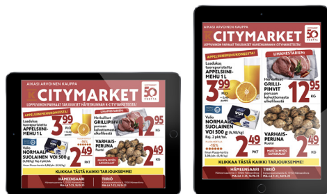
Mallit vaak- ja pystymuotoisesta näköislehden välisivun mainoksista.

Näköislehdellä tarkoitetaan painetun sanomalehden digitaalista versiota, jota pääsevät lukemaan tilattavissa lehdissä lehden tilaajat. Näköislehden mainosmuoto on välisivun mainos, joka näytetään tietyn sivunvaihdon jälkeen. Välisivumainoksesta ohjataan klikatessa mainostajan sivulle.