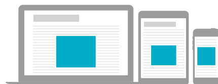
Jättiboksipaketti CPM 12€ 468 x 400px + 300 x 300 px