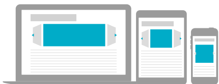
Paraatikarusellipaketti CPM 25€ 980 x 400 px + 300 x 600 px