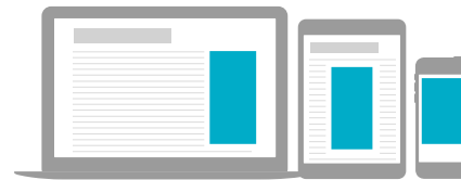
Pystyparaatipaketti CPM 20€ 300 x 600 px