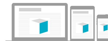
Jättiboksikuutiopaketti CPM 14€ 468 x 400px + 300 x 300 px

Hintoihin lisätään valmiiden aineistojen tarkistusmaksu 5 € sekä alv. Huom! Meiltä myös aineistojen valmistus tarvittaessa. Valmistushinnat alk. 85 €.